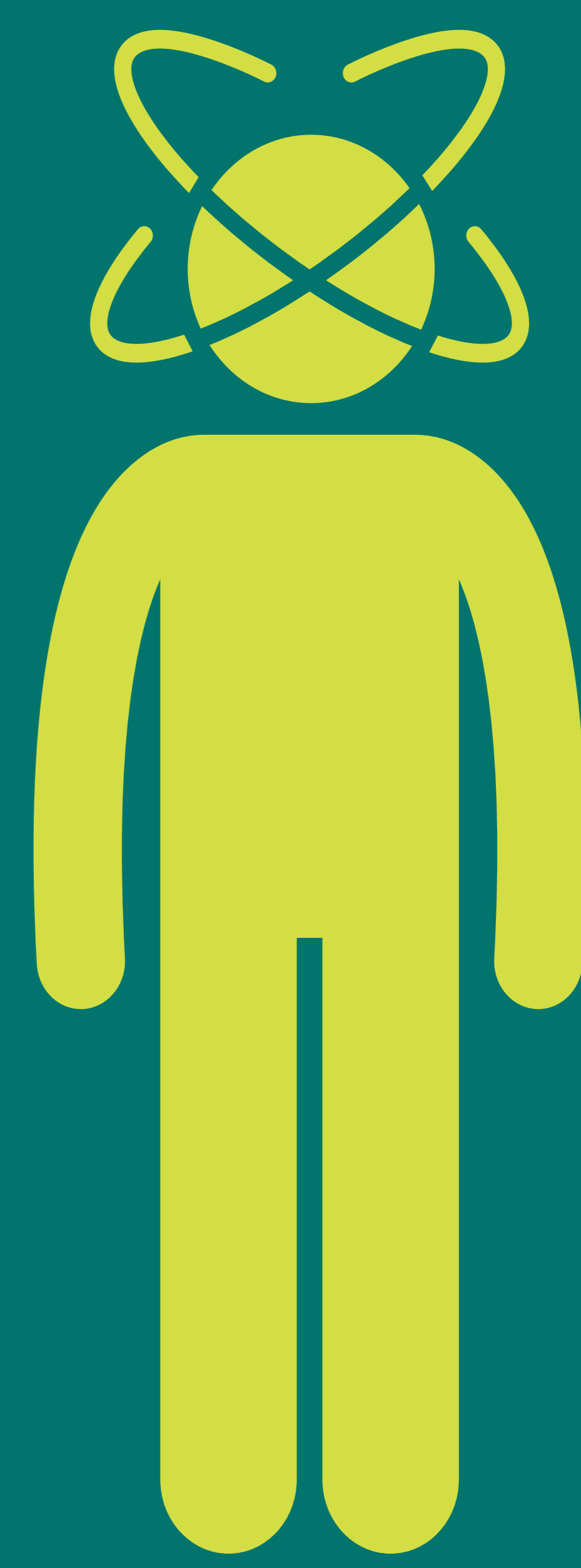
မှတ်ဉာဏ်၊ အာရုံစူးစိုက်မှု တို့နှင့်ပတ်သတ်၍ ဖြစ်လာသော ပြဿနာများ

နာတာရှည်ကိုဗစ် သည် လူတိုင်းအတွက် ကွဲပြားခြားနားနိုင်ပါသည်။ ပြန်လည်သန်စွမ်းကုသသူ တစ်ဦးသည် ဤနာတာရှည်ကိုဗစ်ရောဂါ၏ လက္ခဏာ များကို လေ့ကျင့်ကုသရန်အတွက် ကူညီ ပေးနိုင်ပါသည်။