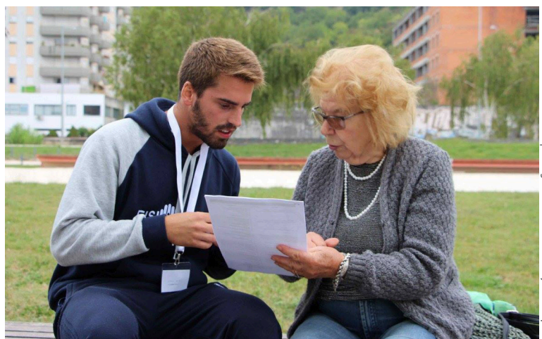
ESF&SC Coimbra Health School | Portuguese Association of Physiotherapists

El ejercicio terapéutico es un tratamiento basado en la evidencia para abordar la depresión, y los fisioterapeutas trabajan con pacientes que sufren depresión junto a los problemas de salud de larga duración. Logar ser y mantenerte físicamente activo te ayudará a mejorar tu salud física y mental. ¡Habla con un fisioterapeuta y descubre un ejercicio o actividad que te resulte divertido y disfruta!