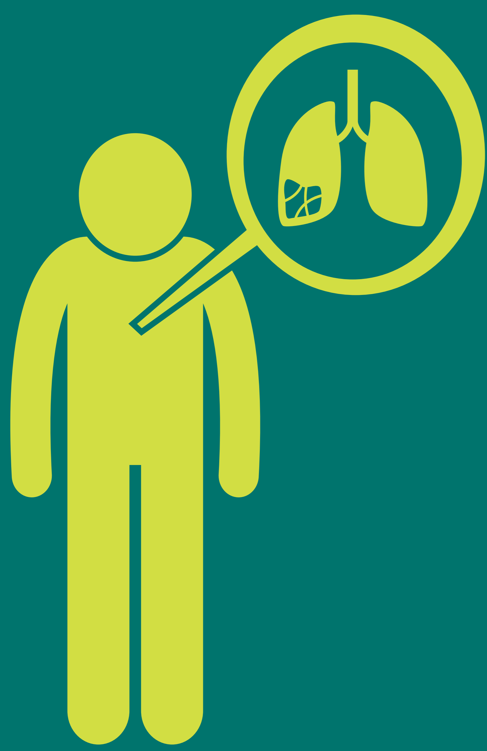
Краток здив /болка во градите