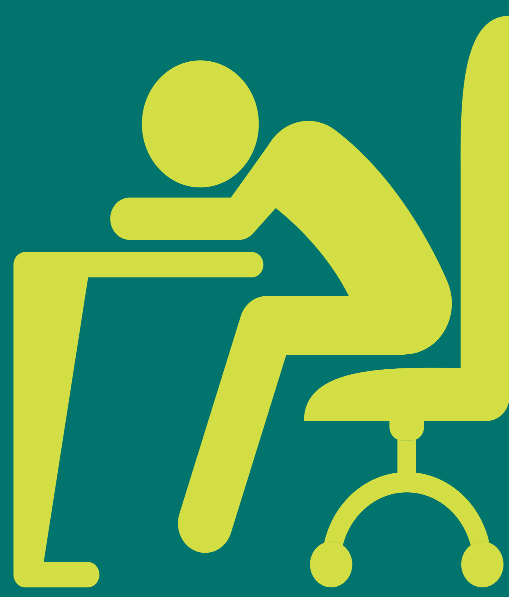
Екстреман замор/ симптом на егзацербација на пост-напор