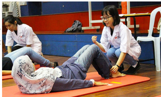
INTI International University | Malaysia

L'exercice est un traitement éprouvé contre la dépression, et les physiothérapeutes travaillent avec des patients qui peuvent souffrir de dépression ainsi que de problèmes de santé à long terme. Logar ser y mantenerte físicamente activo te ayudará a mejorar tu salud física y mental. S'activer physiquement et rester actif vous aideront à améliorer votre santé physique et mentale. Parlez à un physiothérapeute et découvrez un exercice ou une activité qui vous plaît et amusez-vous!