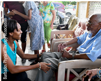
Barbados Physical Therapy Association