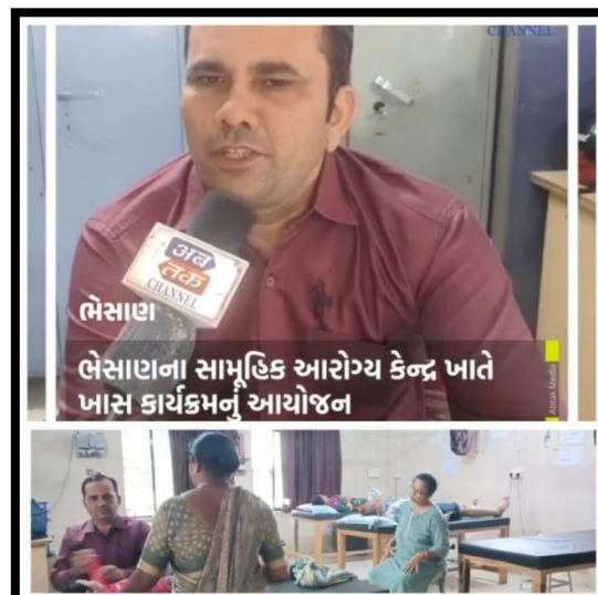
CHC - Bhesan District - Junagadh