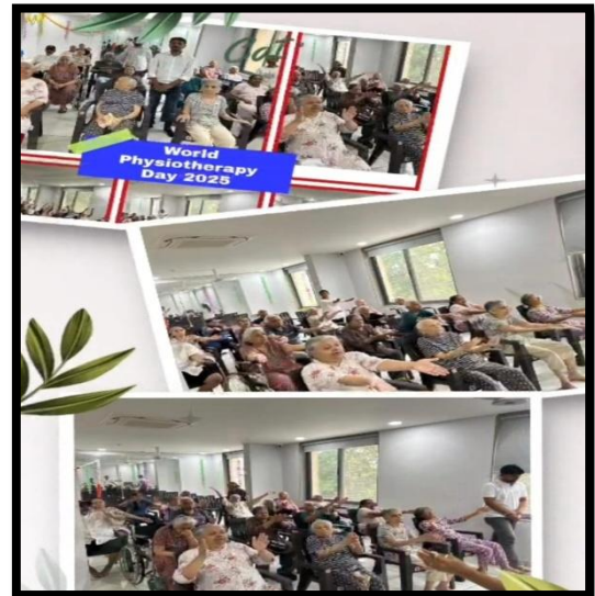
CHC - Nardipur District - Gandhinagar