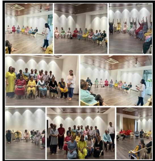
CHC - Dehgam District - Gandhinagar