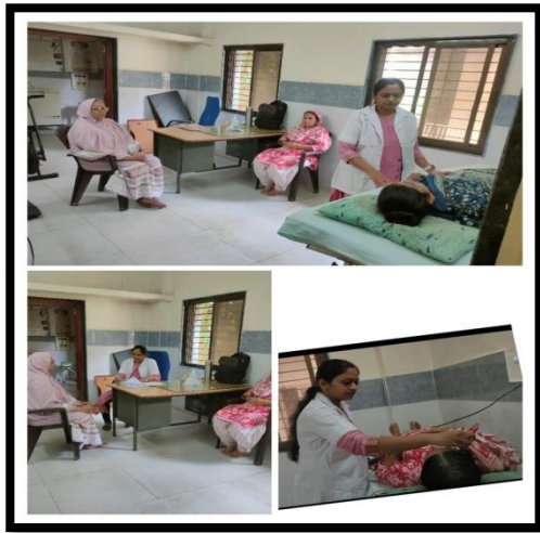
CHC - Zalod Dist. - Dahod