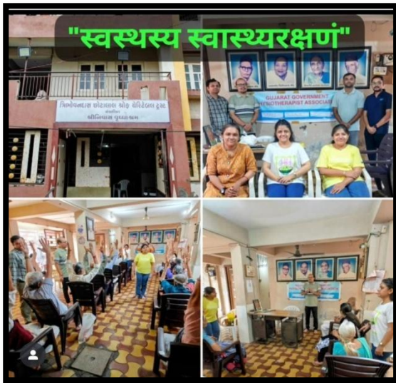
District – Surat