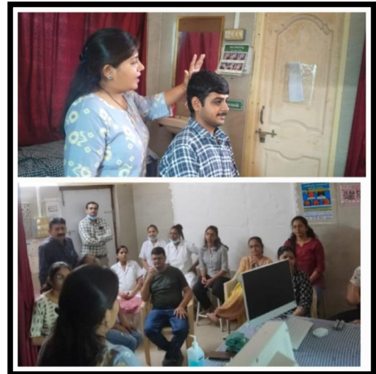
CHC - Olpad District - Surat