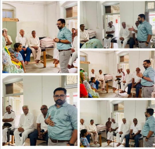
CHC - Wadhwan Dist.-Surendranagar