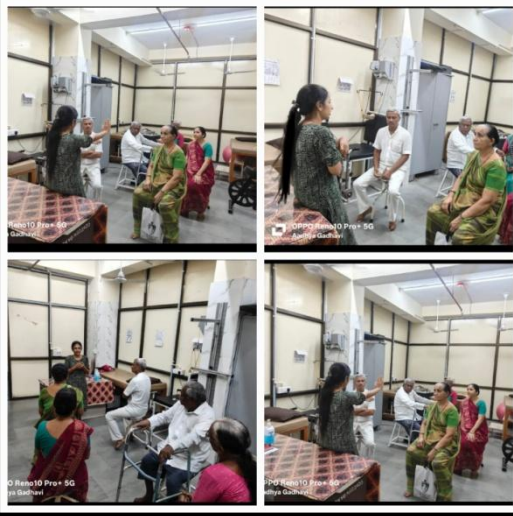
SDH - Viramgam District - Ahmedabad