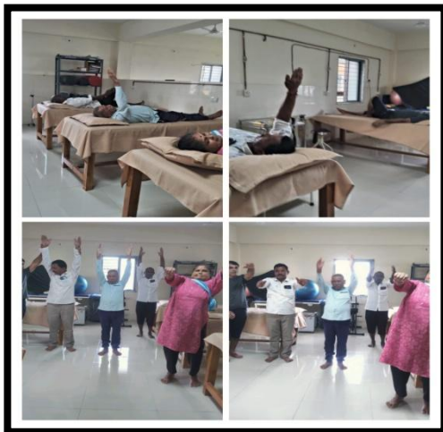
CHC - Rakhiyal Dist. - Gandhinagar