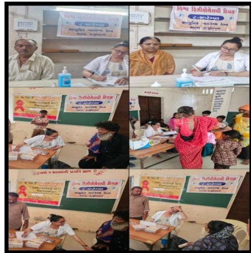
CHC - Thangadh Dist. - Surendranagar