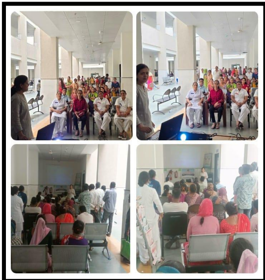
SDH - Bhiloda District - Arvalli