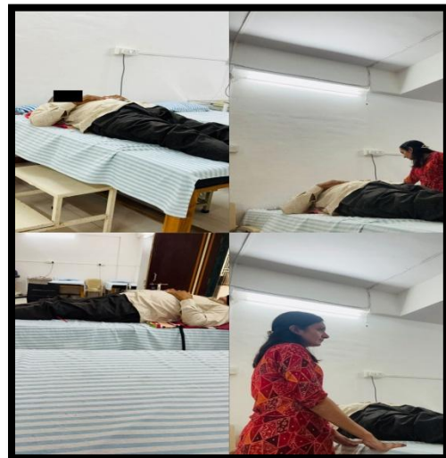
CHC - Khadsupa District - Navsari