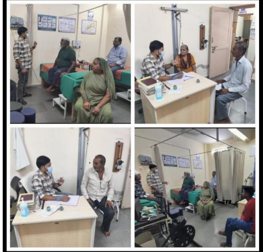
CHC -Salaya Dist. - Devbhumi Dwarka